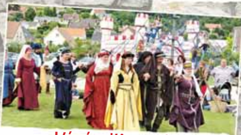
L'épée d'Aymeric Spectacle théâtral avec cascadeurs, jongleurs et danseurs A 15h05 et 16h50 Place Suchetet - Durée 30 min