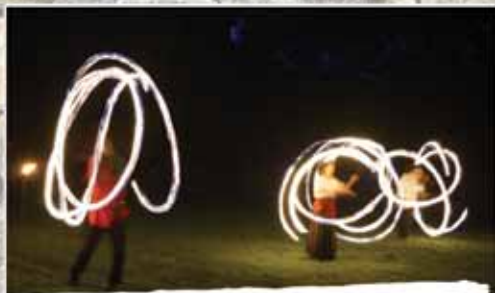
Les Compagnons de la Noë Parade finale avec drapeaux et torches Place Suchetet - De 19h15 à 20h