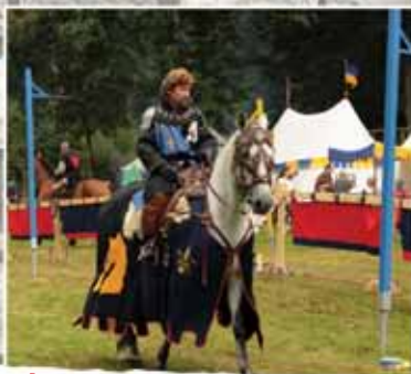
La Mesnie des Chevaliers St Georges et St Michel Spectacle de chevalerie équestre A 13h45, 15h35 et 18h25 Place Suchetet - Durée 30 min