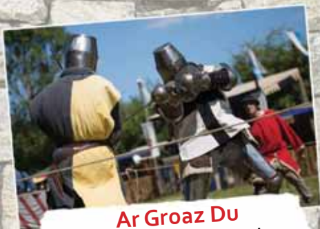
Ar Groaz Du Combats de Béhourd A 13h30, 16h05, 18h10 et 19h Place Suchetet - Durée 15 min