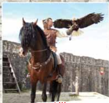
Vol libre Spectacle de fauconnerie équestre A 14h15 (Les Mongols) et 17h20 (Le Moyen Âge) Place Suchetet - Durée 50 min